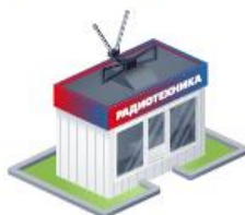
Магазины на рынке радиотехники