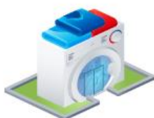
Магазины бытовой техники