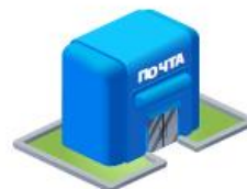
Отделения почтовой связи

Всю дополнительную необходимую информацию о телевизионном вещании в Алтайском крае Вы также можете получить по телефонам: